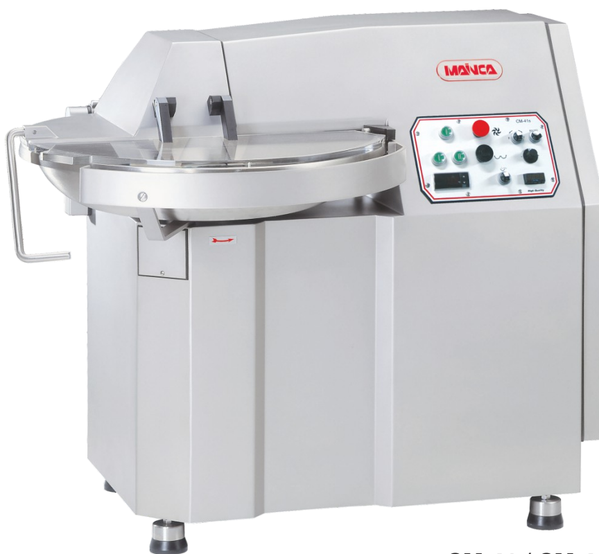
CM-41 / CM-41S