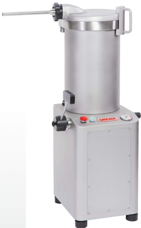
FC-20 / FC-25 / FC-30